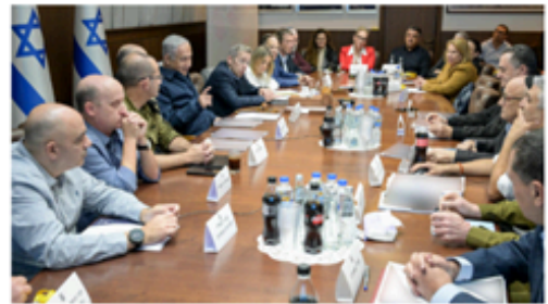
ועדת נגל הציגה את מסקנותיה לראש הממשלה ב-10 בינואר. עליונים "ישראל עולה לראש את צבחה של אום" וד"ר שיינברג בסוריה, נכנס בדורס נהלים הדין נהיה רועם