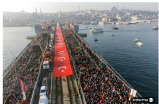
הפגנת הענק נגד ישראל באיסטנבול מואת הענק נגד ישראל באיסטנבול