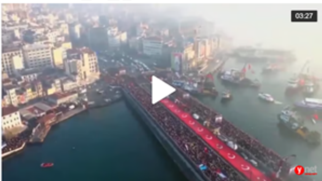
הפגנת הענק נגד ישראל באיסטנבול

לרגל השנה החדשה השתתפו מאות אלפי טורקים בהפגנה למען הפלסטינים ברצועת עזה, בילאל ארדואן תקף את ישראל והשווה את המחבלים בעזה ל"מוסלמים בסוריה שהיו סבלניים והשיגו ניצחון"