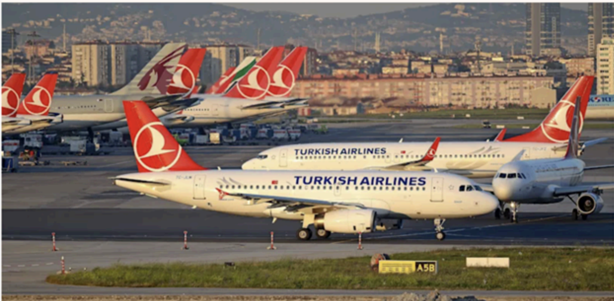
מטוסים של טורקיש איירליינס

חברת התעופה הטורקית טורקיש איירליינס הפסיקה את הפעילות בישראל עם פרוץ המלחמה, אך היא החליטה לשמור על הסלוטים שלה בנתב"ג • עפ"י ההערכות, במהלך מרץ תידרש החברה להכריע האם היא חוזרת לפעילות בישראל